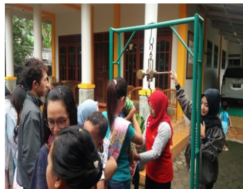
Kegiatan Pendampingan Posyandu