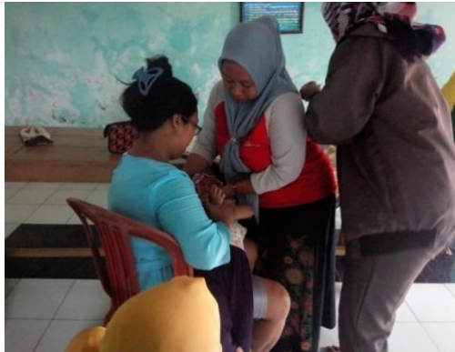
Kegiatan Sosialisasi Makanan dan Minuman Sehat Bidang Lingkungan