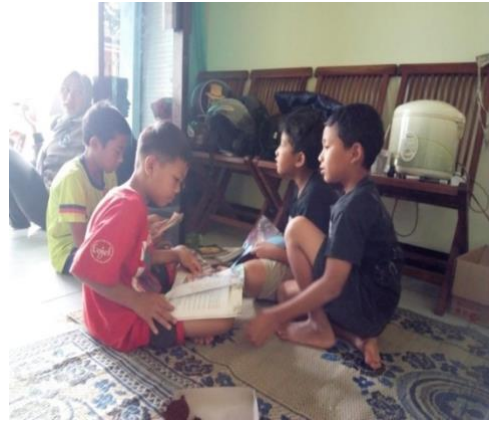
Kegiatan BIMBEL ( Bimbingan Belajar )