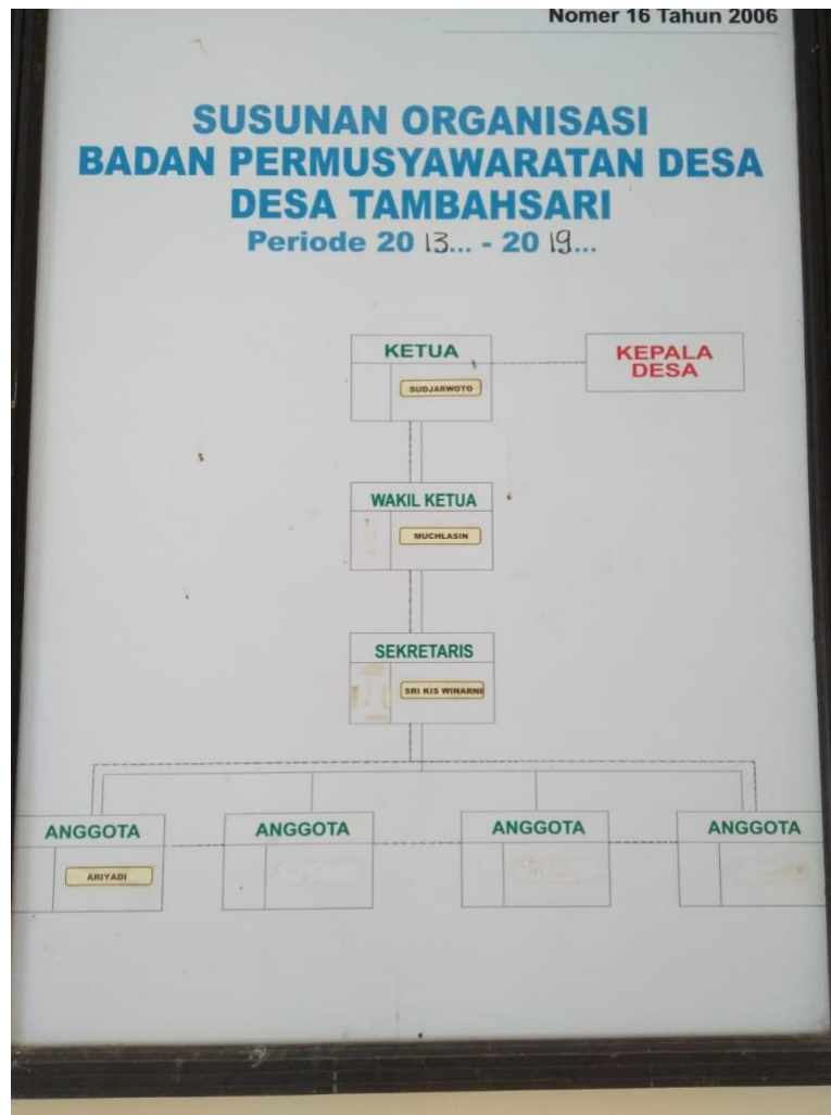
Gambar : Struktur Kelurahan