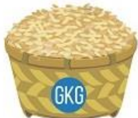
HARGA GABAH KERING GILING