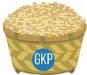
HARGA GABAH KERING PANEN

Berita Resmi Statistik No. 82/09/Th. XX, 04 September 2017