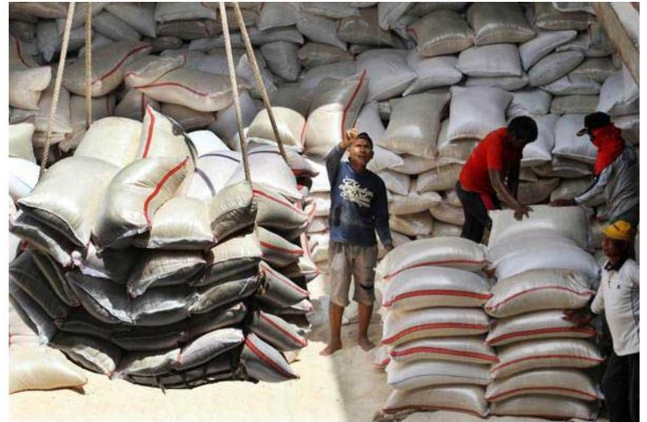
Pekerja membongkar muatan beras Bulog dari kapal, di Pelabuhan Krueng Geukueh, Aceh Utara, Aceh, Rabu (30/8).

Bisnis.com, JAKARTA - Kementerian Pertanian mulai mengagendakan pembahasan atas perubahan kelas mutu beras berdasarkan Standar Nasional Indonesia, menyusul sedang diundangkannya Permentan No 31/2017 tentang Kelas Mutu Beras.