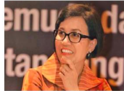
Sri Mulyani Indrawati