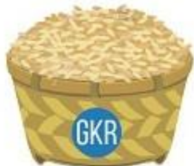
HARGA GABAH KUALITAS RENDAH