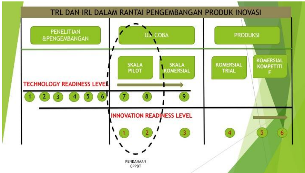
Gambar 1. Tingkat Kesiapan Teknologi ( Technology Readiness Level )